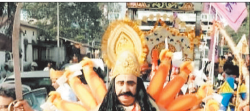
झांकी में शामिल समाज के लोग।

जय सहस्रबाहु जय कलार के आसमान में गूंजते जयघोष लहराते विजय ध्वज हाथ में लिए तलवार, बुलेट में होकर सवार होकर शोभायात्रा निकाली गई। भक्तों को आशीर्वाद देते राज