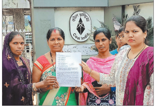
ज्ञापन सौंपती भूविस्थापित महिलाएं।