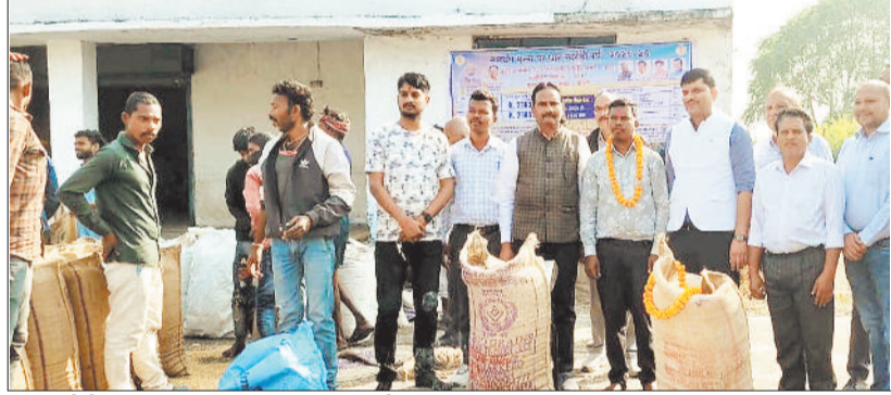
धान खरीदी करते समिति के सदस्य एवं अधिकारी।

खरीफ विपणन वर्ष 2025-26 के लिए जिला सहित प्रदेश में 15 नवंबर से धान उपाजर्जन की प्रक्रिया शुरू हो गई है। इसी कड़ी में पाली विकासखंड के धान उपाजर्जन केंद्र में पारंपरिक रीति-