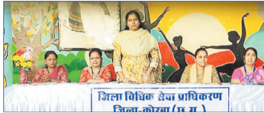
विधिक साक्षरता शिविर को संबोधित करते हुए।

छग राज्य विधिक सेवा प्राधिकरण बिलासपुर के स्टेट प्लान आफ एक्शन के अनुसार एवं प्रधान जिला एवं सत्र न्यायाधीश/अध्यक्ष, जिला विधिक सेवा प्राधिकरण कोरबा के निर्देशानुसार कस्तुरबा गांधी बालिका आवासीय विद्यालय कोरबा में आयोजित विशेष जागरूकता कार्यक्रम में शिक्षा के ऐतिहासिक विस्तार उसके विकास सुगमता और कानूनी साक्षरता की महत्ता पर चर्चा कार्यक्रम में मुख्य वक्ता सचिव