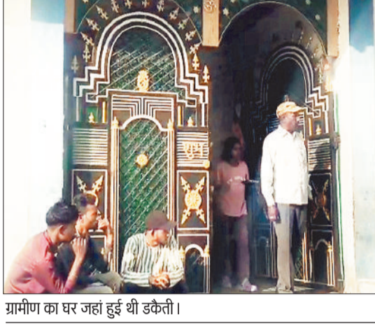
ग्रामीण का घर जहां हुई थी डकैती।

सोनगुडा के तरईडांड गांव में विगत दिनों हुए डकैती के मामले में अब तक पुलिस को कोई ठोस सुराग नहीं मिल पाया है, लेकिन पुलिस की विशेष टीम अपराधियों के गिरेबाह तक पहुंचने के लिए हर संभव प्रयास में जुटी हुई है। दिन और रात पुलिस की टीम अलग अलग पहलुओं की पड़ताल में जुटी हुई है ताकि अपराधियों को जल्दी पकड़कर सलाखों के पीछे भेजा जा सके। पिछले कई दिनों से पुलिस अलग अलग पहलुओं की पड़ताल में जुटी हुई है। संभावना जतायी जा रही है कि जल्द ही पुलिस आरोपियों के करीब पहुंच जाएगी।