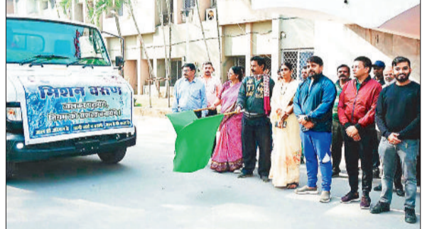
हरी झंडी दिखाकर मिशन वरुण को रवाना करते हुए।

मिशन हेतु रवाना किया। महापौर ने आमजन से जल संरक्षण की अपील करते हुए कहा कि जल ही जीवन है। पानी की एक-एक बूंद कीमती है, अतः पानी का सदुपयोग करें उसे व्यर्थ न बहने दें। निगम का देय जल कर का भुगतान समय पर करें तथा व्यवस्था की बेहदरी में अपना महत्वपूर्ण सहयोग दें। जल की बचत एवं उपयोगिता के प्रति