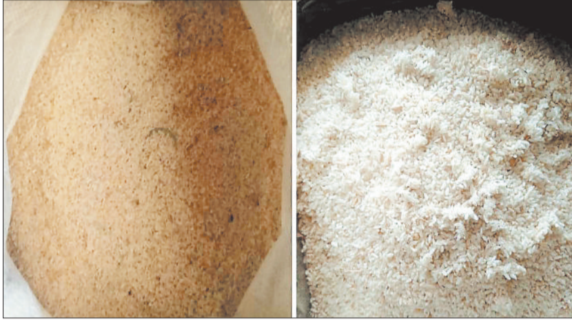
हितग्राहियों को मिला खराब चावल।