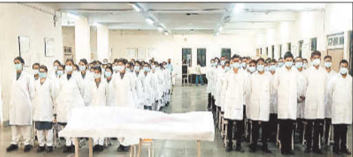
समारोह में शामिल चिकित्सक।

स्व. बिसाहू दास महंत स्मृति चिकित्सा महाविद्यालय में प्रथम वर्ष एम.बी.बी.एस. के विद्यार्थियों के लिए कैडेवरिक ओथ समारोह का आयोजन किया गया। इस कार्यक्रम का उद्देश्य शरीर दाताओं के अमूल्य योगदान को सम्मानित करना तथा विद्यार्थियों में चिकित्सा शिक्षा के प्रति आदर, नैतिकता और पेशेवर जिम्मेदारी की भावना का विकास करना था। कार्यक्रम की शुरुआत एनाटॉमी विभागाध्यक्ष द्वारा की गई। उन्होंने विद्यार्थियों को चिकित्सा शिक्षा में कैडेवरिक अध्ययन के